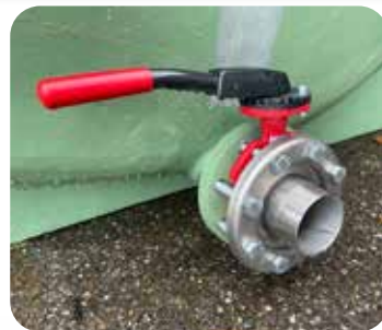
Vanne inox 3"