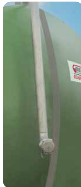
Tube de remplissage en 3" à hauteur d'homme en inox avec clapet anti-retour (option)