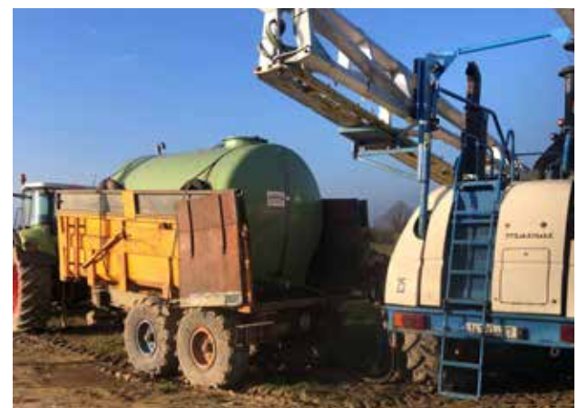
Citerne dans une benne pour ravitaillement du pulvérisateur