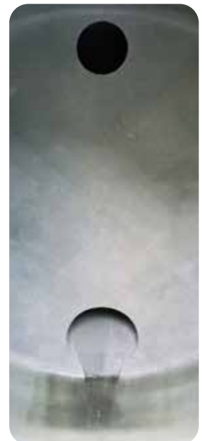
Brise-lames intérieur, évite le balancement de l'eau