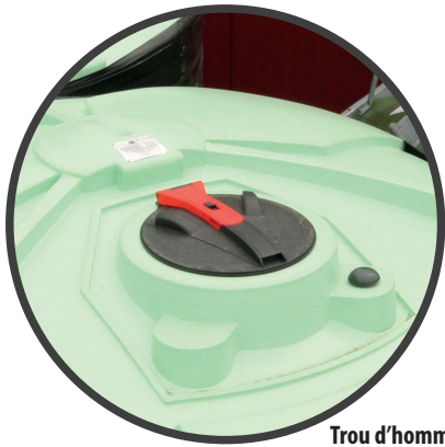
Trou d'homme (Ø 440mm) avec évent