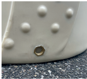
Emplacement pour purge