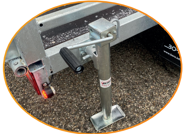
Manivelle, béquille au sol