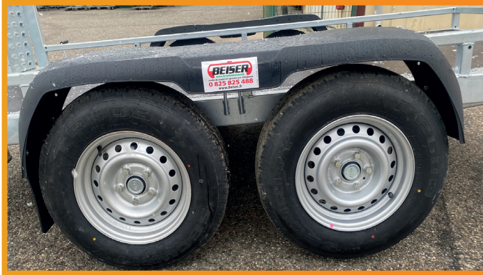
Roues 185R14C/102/100S - Double essieux