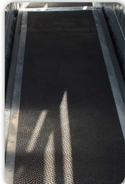
Tapis antidérapant sur toute la longueur du couloir