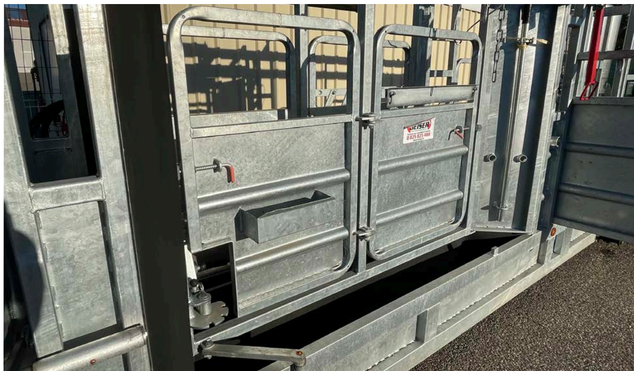
Réducteur de largeur 800-400 mm