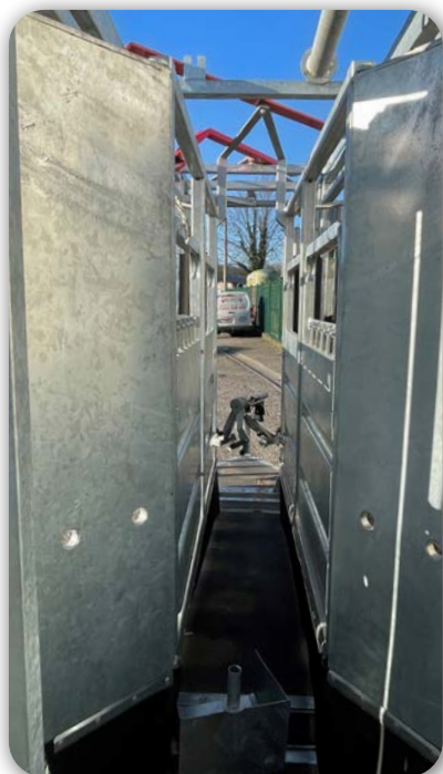
Réducteur de largeur 800-400 mm sur la partie avant du couloir