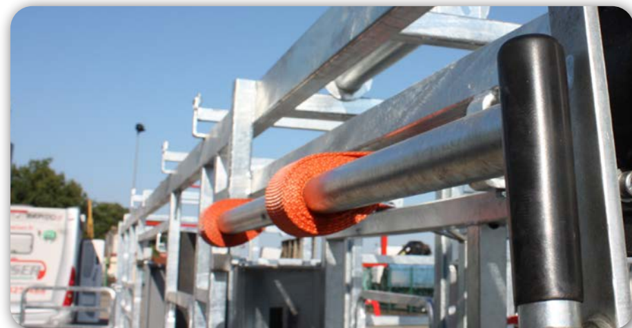
Treuil sangle ventral

BEISER Environnement • Domaine de la Reidt 67330 BOUXWILLER