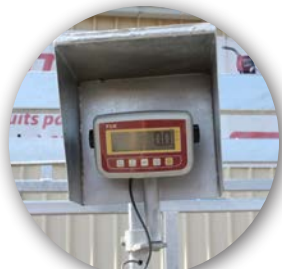
Système de pesée de série