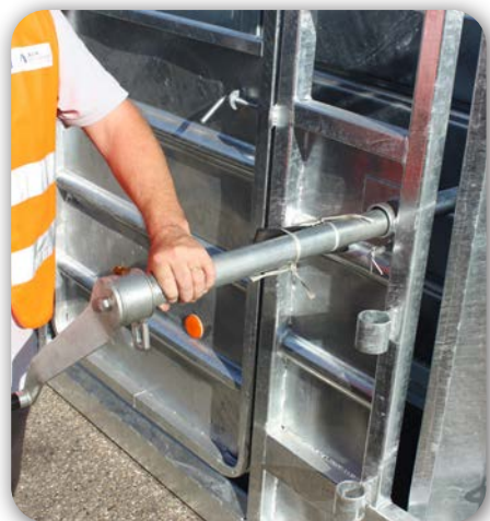
Treuil parage patte arrière amovible