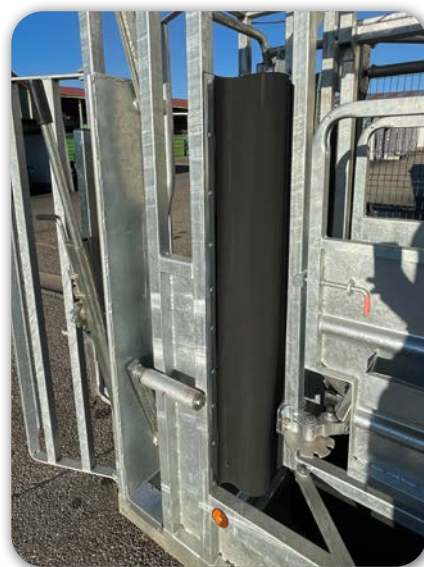
Protection par soufflets en caoutchouc au niveau de la porte avant. Évite au jeune bétail de passer la tête

BEISER Environnement • Domaine de la Reidt 67330 BOUXWILLER