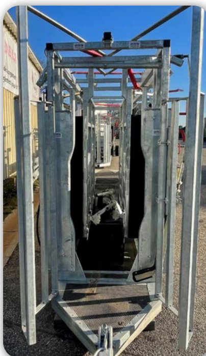
Porte avant à serrage central avec corbeille