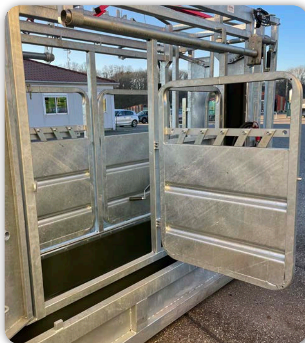
Ouverture totale des portes sur la cage avant

BEISER Environnement • Domaine de la Reidt 67330 BOUXWILLER