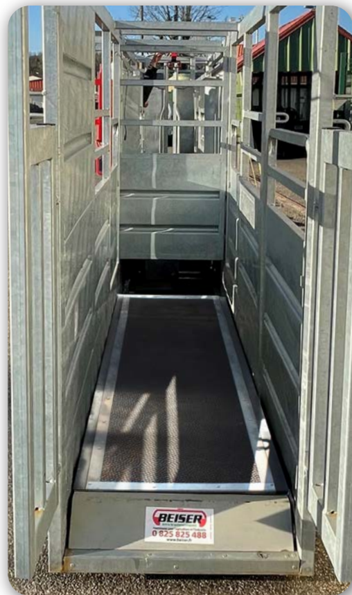
Plateforme de pesage