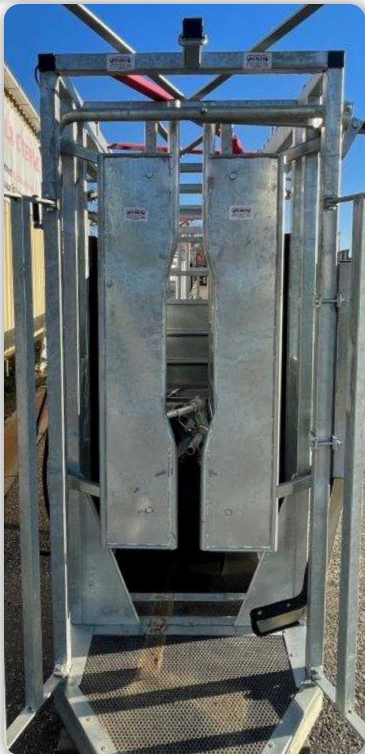
Porte avant avec fermeture de l'encolure pour le bétail réglable