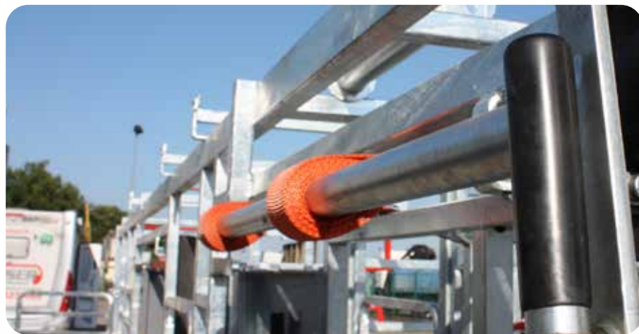
Treuil sangle ventral

BEISER Environnement Domaine de la Reidt • 67330 BOUXWILLER