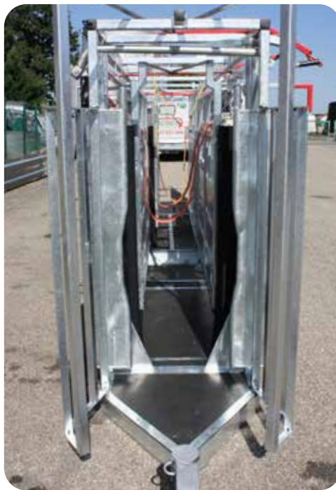
Porte avant à serrage central avec corbeille