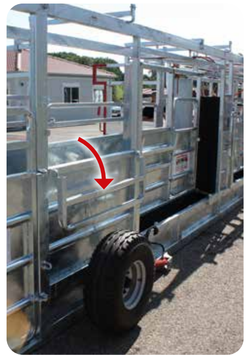
Côté rabattable (accès facilité sur le dos de l'animal)

BEISER Environnement Domaine de la Reidt • 67330 BOUXWILLER