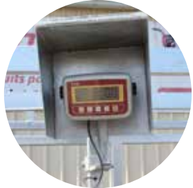
Système de pesée de série