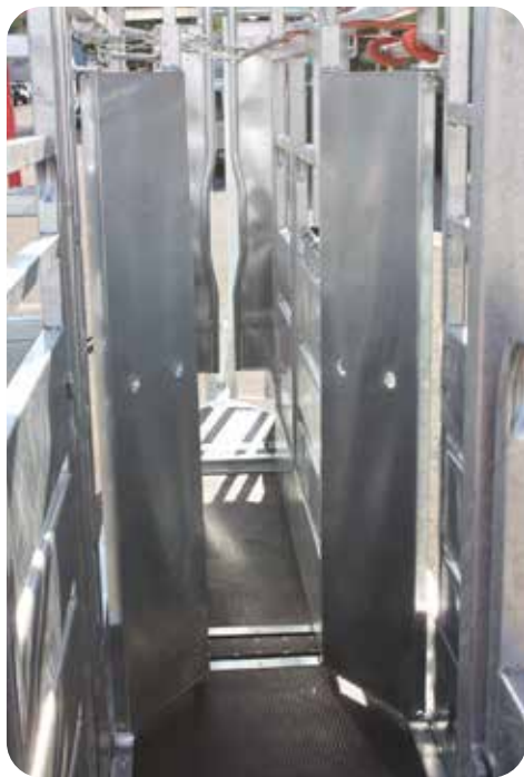
Réduction largeur 800 - 400 mm