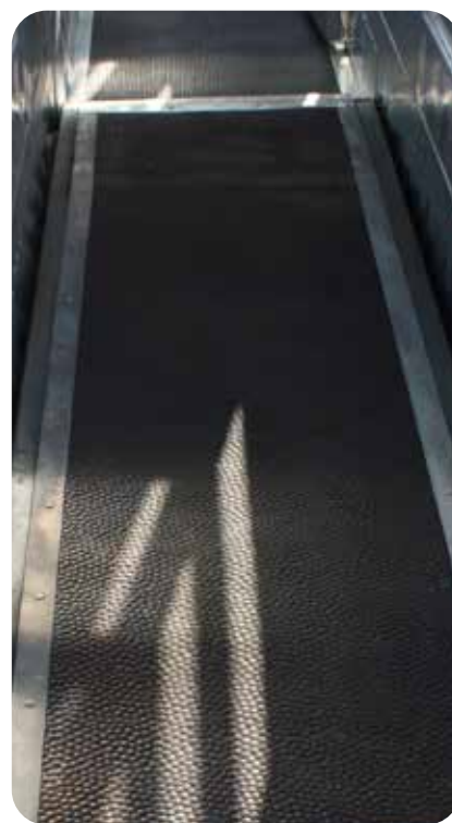
Tapis antidérapant sur toute la longueur du couloir