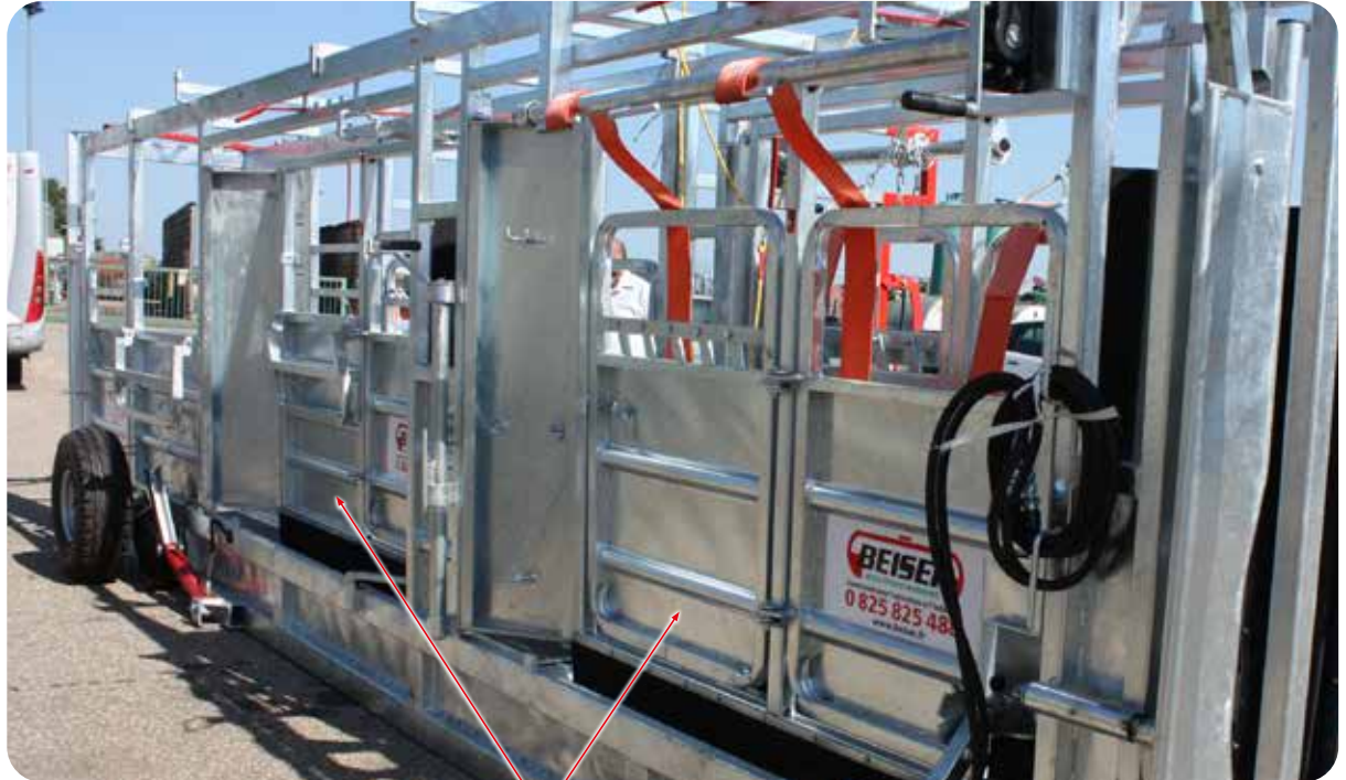
Réduction de largeur sur le compartiment de pesée et de contention avant