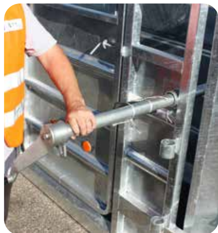
Treuil parage patte arrière amovible