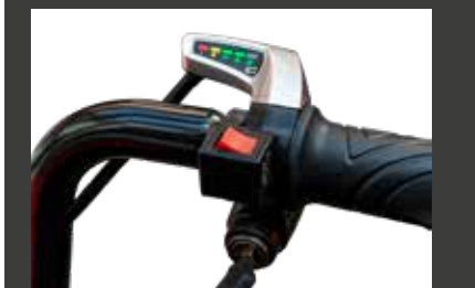
Sélecteur marche av/ar sur la poignée avec indicateur de charge