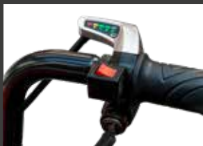
Sélecteur marche av/ar sur la poignée avec indicateur de charge

Batterie 24V 12AH rechargeable / amovible