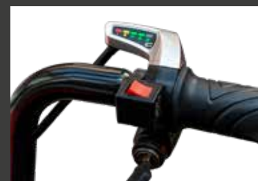
Sélecteur marche av/ar sur la poignée avec indicateur de charge

Idéal pour transporter toutes sortes d'objets lourds confortablement et en toute sécurité.