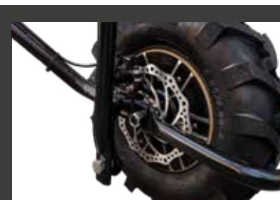
Frein à disque mécanique