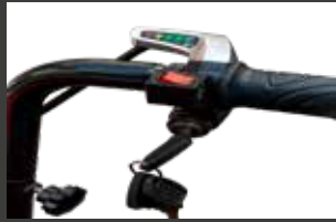
Sélecteur marche av/ar sur la poignée avec indicateur de charge