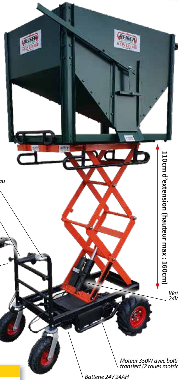
Indicateur de niveau de batterie