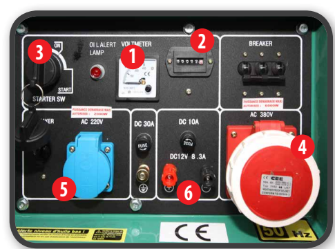
Tableau de bord avec compteur d'heures