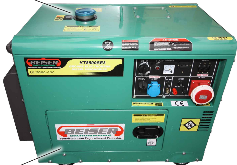
Groupe électrogène sur 4 roues