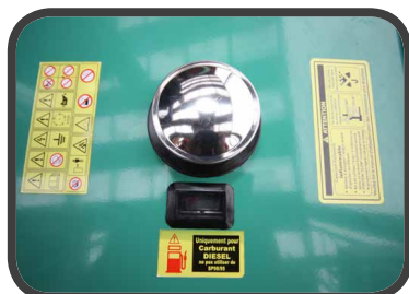
Réservoir à carburant avec jauge de niveau