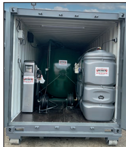
Station AdBlue double paroi

Ce conteneur sur berce peut être réalisé en version aménagée sur demande, avec des étagères, bac de rétention, citerne, groupe électrogène ou autre.