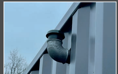
Event de la citerne gasoil hors du conteneur

BEISER Environnement Domaine de la Reidt • 67330 BOUXWILLER