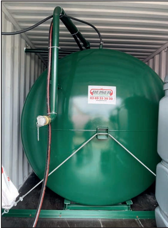
Citerne gasoil 10 000L double paroi arrimée au conteneur

➤ Exemple d'un conteneur aménagé pour stockage et distribution de carburant et d'AdBlue sur un chantier de longue durée.