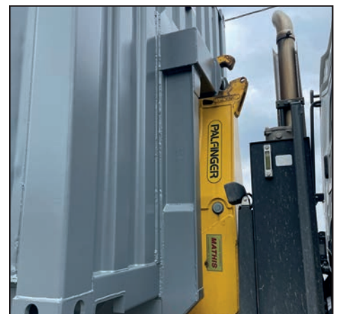
Accroche du bras Ampliroll replié en position transport

BEISER Environnement Domaine de la Reidt • 67330 BOUXWILLER