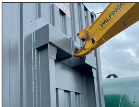
Accroche du bras de manutention Ampliroll au col de cygne du container pour le chargement