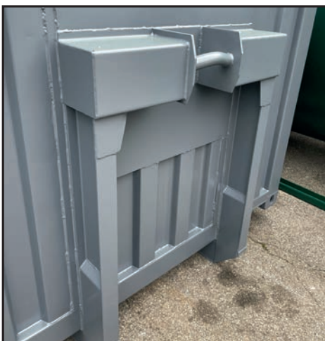
Col de cygne