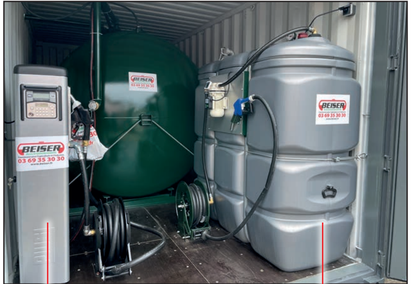
Distributeur à gestion intégrée