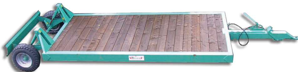
Plancher 27 mm traité autoclave

BEISER Environnement • Domaine de la Reidt 67330 BOUXWILLER • Fax : 0 825 720 001